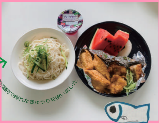
崇徳院で採れたきゅうりを使いました