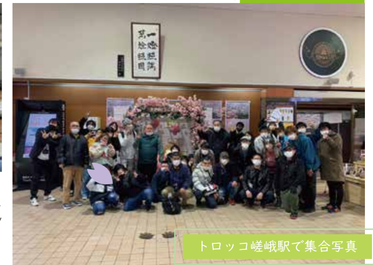
トロッコ嵯峨駅で集合写真