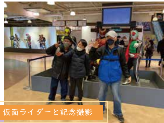
仮面ライダーと記念撮影