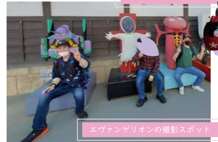
エヴァンゲリオン撮影スポット

3月15日の日帰り旅行では、組紐ストラップ作りに参加したり、太秦映画村で観光したりと皆様充実した時間を過ごされていました。お刺身や天ぷらなどが入ったおいしい昼食を召し上がった後、映画村では様々なアトラクションを楽しまれておりました。お土産も購入され皆様満足されていました。